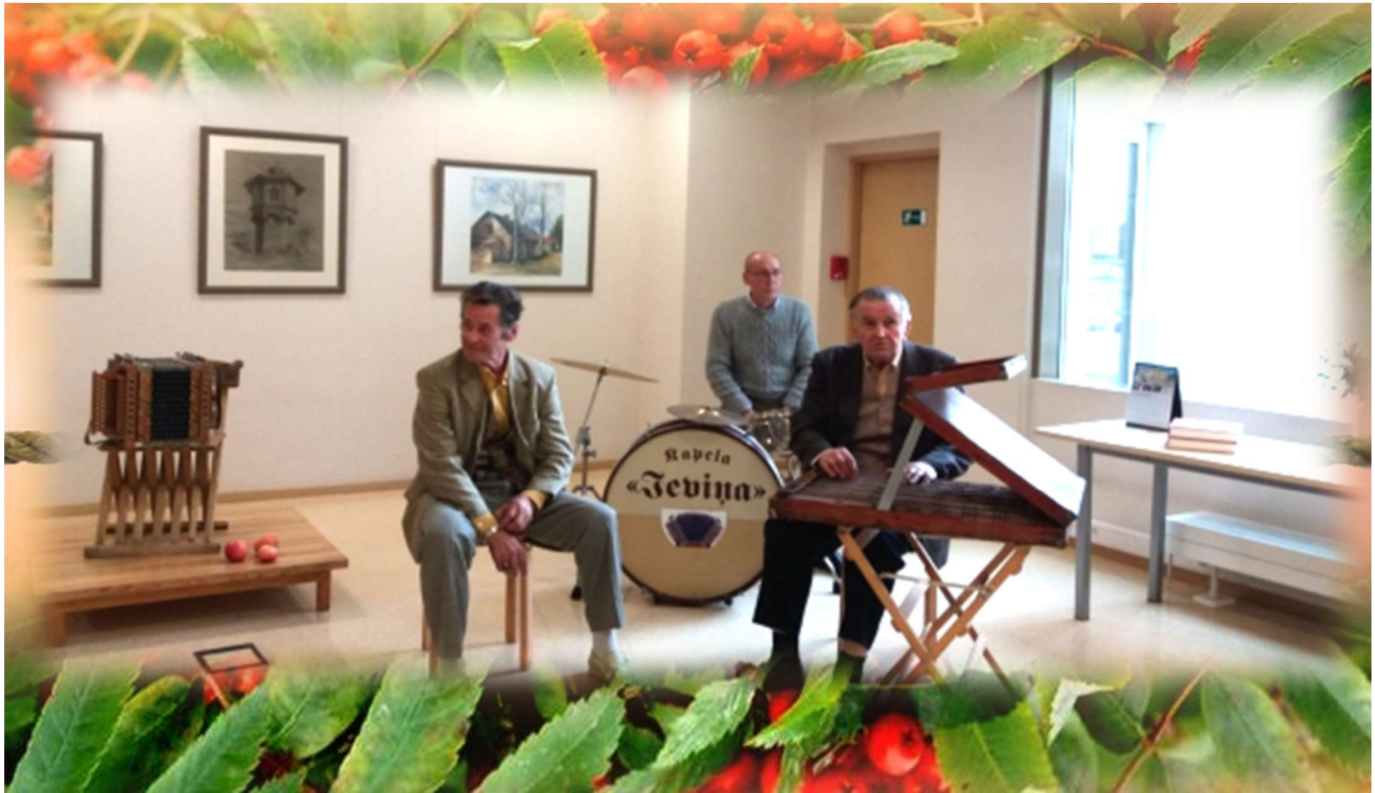
Vidzemes stāstnieku festivāls "Stāsti krēslā"