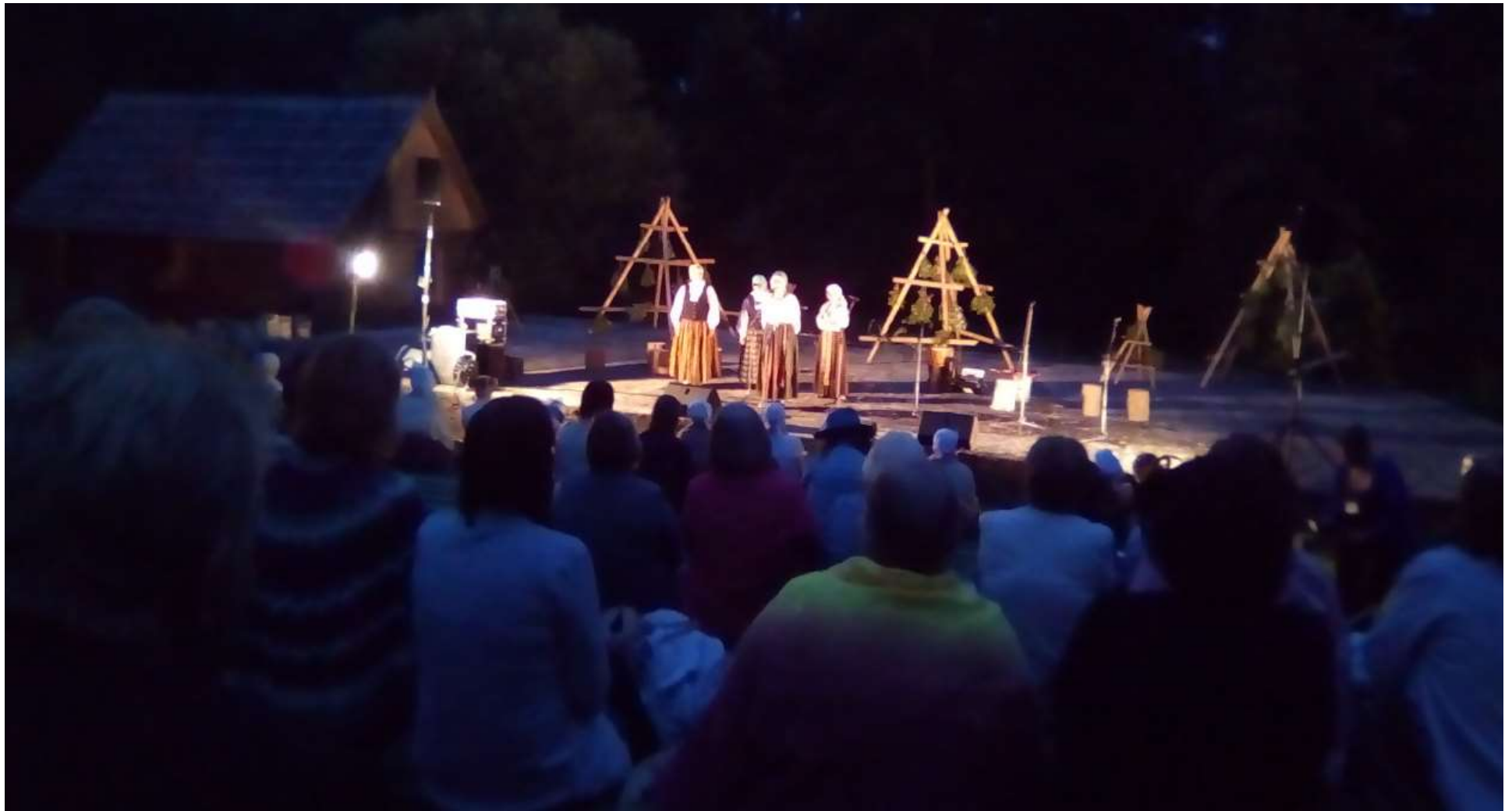
Latgales stāstnieku festivāls “Omotu stuosti”