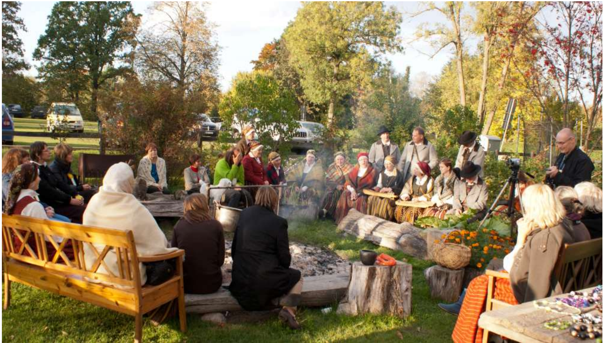
Zemgales stāstnieku festivāls “Gāž podus Rundālē”