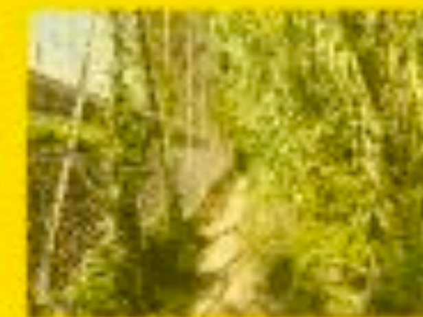
Vitrolles 30/09/2011 15h20