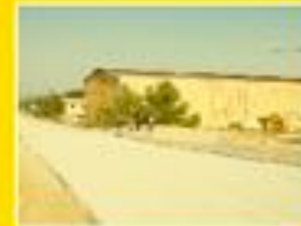
Chateauneuf les Martigues 14/03/2012 12h53