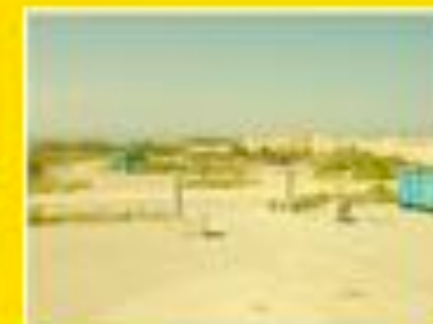
Marignane 30/05/2012 10:55