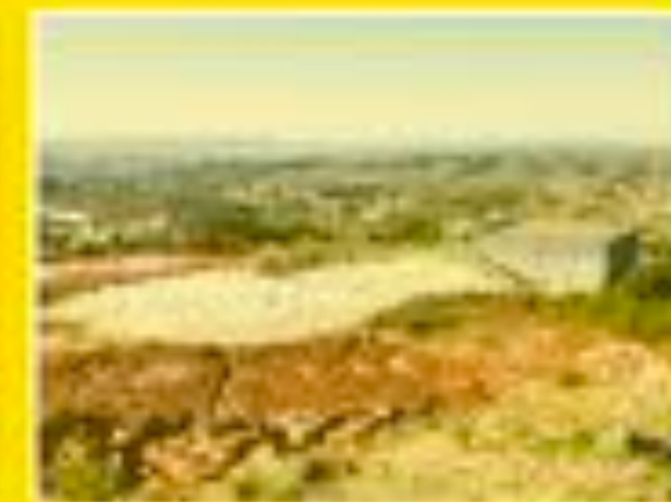
Vitrolles 03/12/2012 12h11