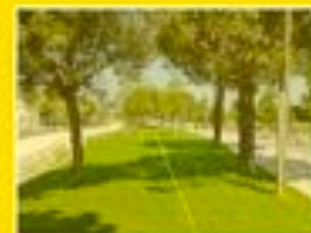
Marignane 30/05/2012 12h31