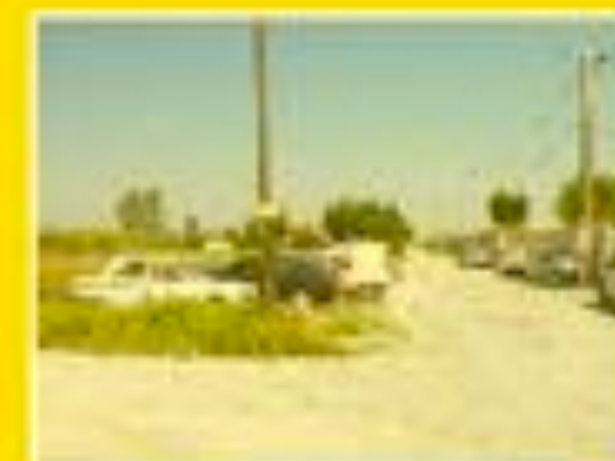
Marignane 30/05/2012 11h44