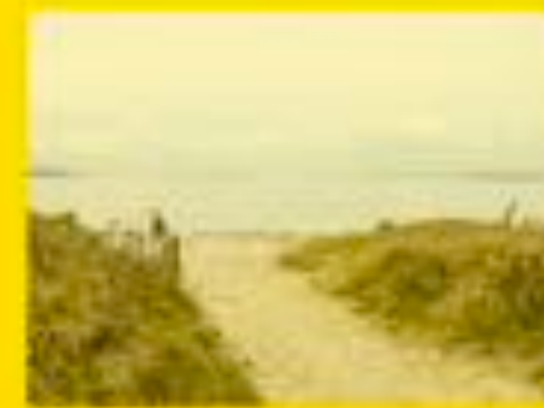
Chateauneuf les Martigues 20/03/2012 13h49