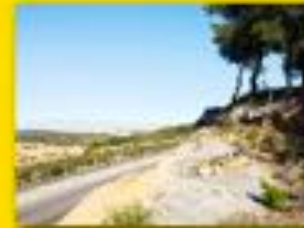
Vitrolles 03/12/2012 11h45