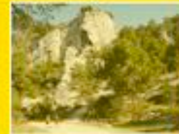
Chateauneuf les Martigues 14/03/2012 14:36