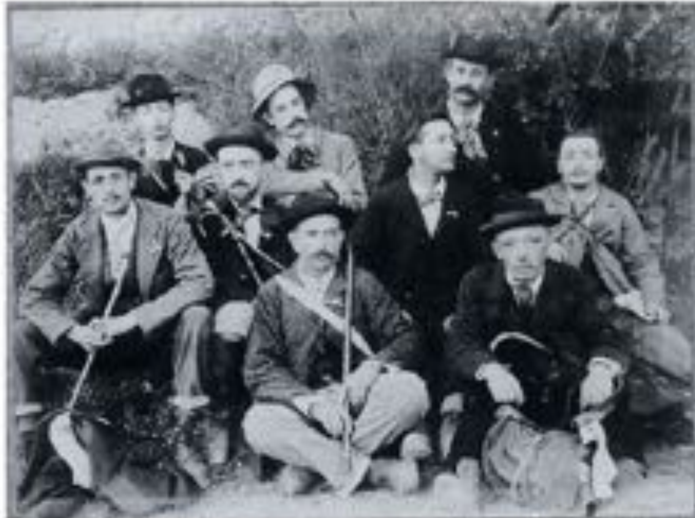
Les fondateurs de la Société des Escarmentistes marseillais (1887)