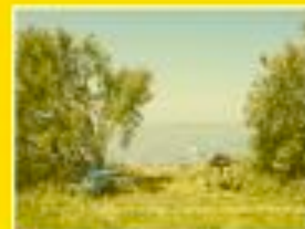
Marignane 30/05/2012 12:58