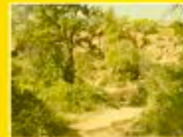
Vitrolles 30/09/2011 14h15