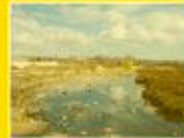
Chateauneuf les Martigues 20/03/2012 11:26